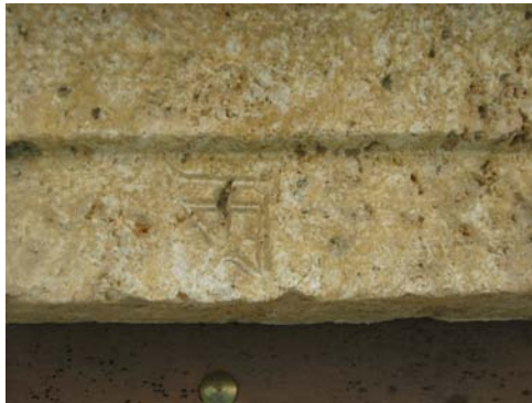
Kamnoseška znamenja s cerkve na sv. Primožu.

Kamnoseško znamenje je osebno oz. avtorsko znamenje kamnoseka, ki je tako označil svoje delo. Nekateri menijo, da so znaki služili za obračun plačila kamnoseka. Pojavljajo se od 12. do 16. stoletja. Pri tem pa manjših kamnoseških znamenj ne smemo zamenjevati z bolj poudarjenimi, večjimi in lepše oblikovanimi mojstrskimi kamnoseškimi in drugimi obrtniškimi znamenji, kot je ta na reliefu svetega Florijana.