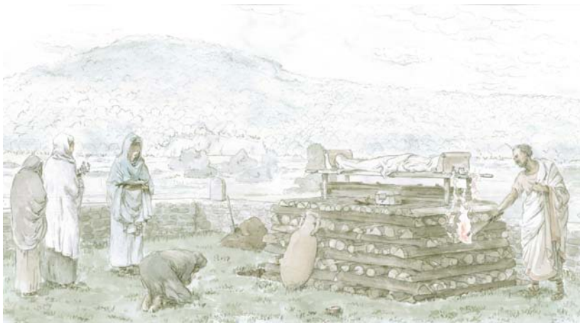
Poskus rekonstrukcije pogrebnega rituala iz 1.-2. stoletja. Risba: Marko Zorović.