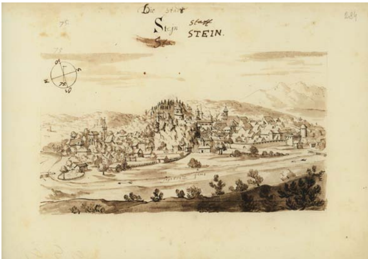
J. V. Valvasor, skica Kamnika za Topographia Ducates Stiria, 1679.

Kamniško mestno ozemlje – (pomerij, Burgfried) se je izoblikovalo s pridobitvijo mestnih pravic in drugih privilegijev, mesto ga je v upravnem in sodnem pogledu upravljalo. To je med drugim pomenilo, da je na tem ozemlju sodil lahko samo mestni sodnik. Meščani so uživali pravico do gozdov v neposredni okolici mesta, obdelovali komplekse izkrčenega sveta za njive ali vrtove, imeli pravico do pobiranja davščin, obenem pa so prevzeli skrb za ceste, mostove in obzidje. Ozemlje mestnega pomirja so skozi stoletja vestno označevali s podobnimi mejniki.