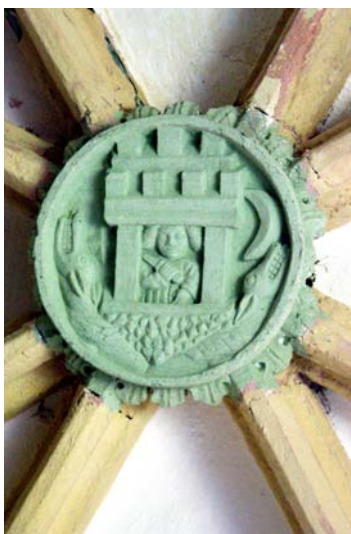
Najstarejši kamniški grb na sklepniku v cerkvi svetega Primoža, okoli 1470.

Z grbovno ploščo se je mesto Kamnik po izdaji cesarskega privilegija leta 1489 želelo zahvaliti cesarski vladarski hiši, ki je potrdila privilegij svobodnih volitev sodnikov (županov). Na tej grbovni plošči je ohranjen drugi najstarejši kamniti kamniški grb iz okoli leta 1490, nekoliko starejši pa je ohranjen na sklepniku v cerkvi sv. Primoža. Na njem je upodobljena sv. Marjeta kot zaščitnica mesta Kamnik.