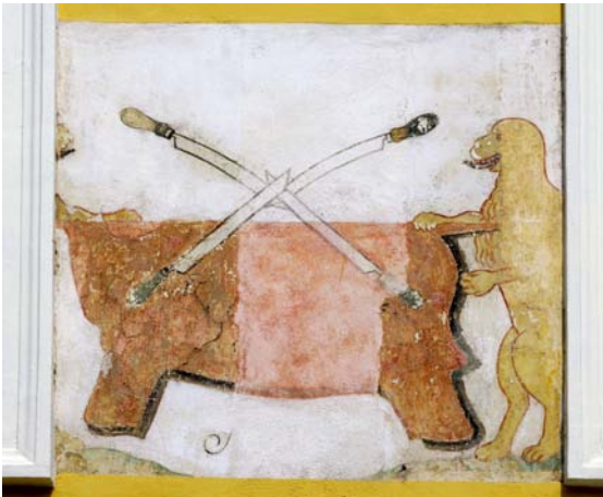
Freska usnjarskega znamenja s pročelja hiše na Šutni 48, Kamnik. Konec 18. stoletja.

Usnjarstvo ima v Kamniku dolgo tradicijo, od srednjeveških obrtnih delavnic do tovarne Utok. Znamenje, ki simbolizira usnjarsko obrt, pa se skozi čas ni bistveno spreminjalo. To dokazuje ohranjena freska na pročelju hiše na Šutni 48, s konca 18. stoletja. Upodobljena sta leva, ki drži živalsko kožo, spredaj se križajo štiri usnjarski noži za čiščenje kož. Podobno usnjarsko znamenje je tudi na cehovskem vrču na razstavi Odsevi kamniških tisočletij v gradu Zaprice.